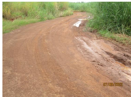
รูปที่ 5 เส้นทางรถขนส่งแร่