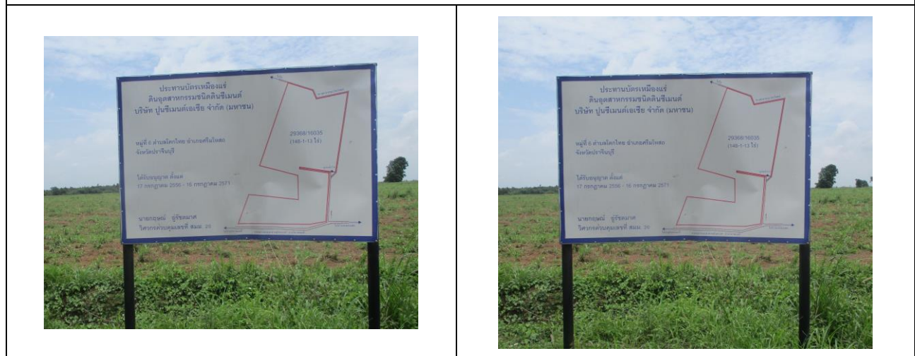
รูปที่ 2 ป้ายกำหนดแผนผังการทำเหมือง