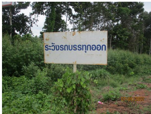
รูปที่ 4 ป้ายเตือนจราจรบริเวณทางเข้า-ออกโครงการ