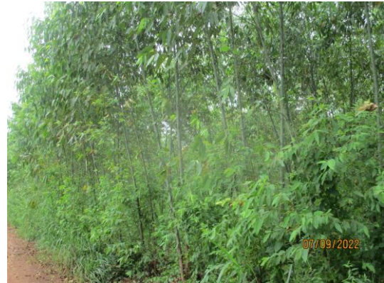
รูปที่ 3 ไม้ยืนต้นในพื้นที่เว้นการทำเหมือง